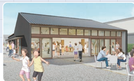
(イラストはイメージです)