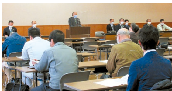
11/9 戦略の完成を被災者関係者説明会で説明

実践活動や施設との連携等による、活動フィールドの充実を図るため、駅北復興まちづくり計画におけるにぎわいの拠点施設については、「複数分散型のまちづくり」と「子育て支援を中心とした機能」の2つの方向性に沿って、令和3年度以降に具体的な施設の検討を行います。